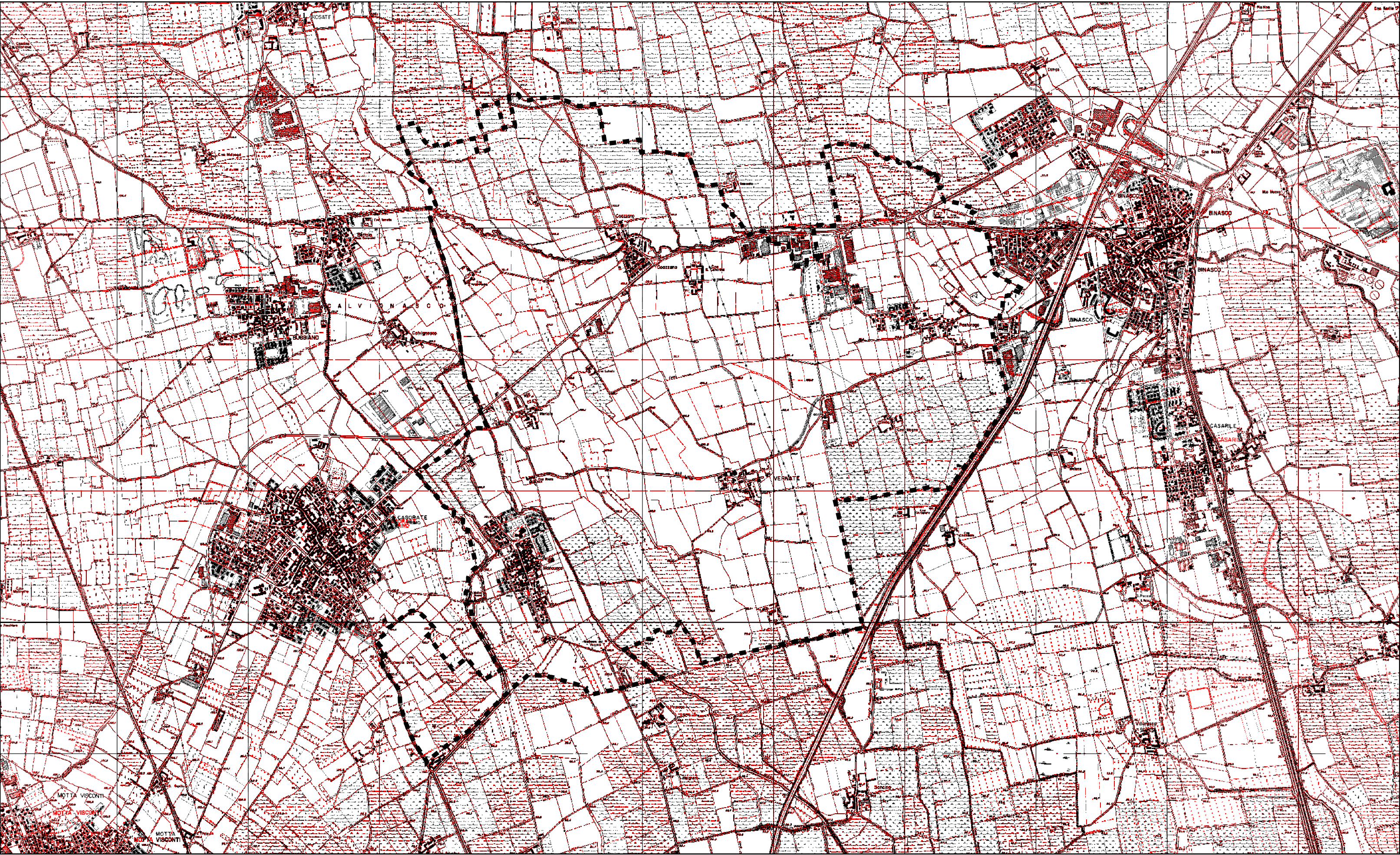
SOVRAPPOSIZIONE CTR 1984 ALLA CTR DEL 1994 Scala 1:25.000